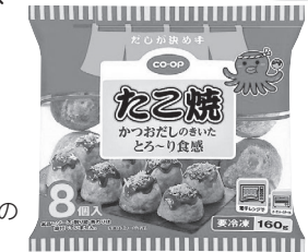
「たこ焼」 今回お届けの3月3回(150号)の カタログでご案内しています。