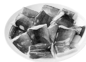
「やりいか輪切り」 今回お届けの3月3回(150号)の カタログでご案内しています。

組合員さん：このやりいか輪切りがすごく重宝してるのよ。 地域責任者：煮物とか揚げ物とかですか？ 組合員さん：どっちにも使うんだけど、普通とはちょっと違うのよね。 地域責任者：よかったですら教えてください。 組合員さん：まず、大根をさいのめ切りにしたのと一緒に煮物を作るの。このやりいかはとてもやわらかいから、すぐに味がしみ込んでくれて、短時間でできちゃうのよ！煮物は、大根をたくさん入れるから余っちゃうんだけど、今度はその大根の煮汁を切って、片栗粉で唐揚げにするのよ。やりいかの美味しい煮汁をふくんでいるから、唐揚げもおいしくなって、家族みんなが好きなのよ！ 地域責任者：大根の唐揚げって初めて聴きましたけど、確かにやりいかの旨味をふくんで、とてもおいしそうですね！