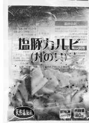
「塩豚カルビ(丼の具)」 今回は3月5回(152号)のカタログで ご案内予定です。