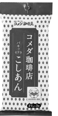
「パキッテこしあん」

コメダ珈琲店「パキッテこしあん27g×3」について、取引先に確認したところ、カタログでの取り扱いが可能です。今回のご意見のように少量を使いたい方にとつても無駄がなく、組合員さんに喜ばれる商品ではないかと考えられたことなどから、カタログでの品揃えを進めていきます。なおご案内の時期は、3月を予定しています。しばらくお待ちいただければと思います。