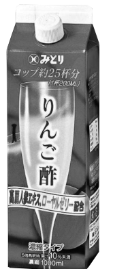
「りんご酢」 今回お届けの1月3回(142号)の カタログでご案内しています。

地域責任者: りんご酢が届いてますね! 組合員さん: これ、久しぶりに注文したのよ。 地域責任者: どうやって使われるんですか? 組合員さん: 牛乳で割って飲んだり、牛乳がない時には水で割ったり...。あとは、オリーブオイルとりんご酢、塩、コショウでタレを作って、カルパッチョにかけたりするのよ! 地域責任者: その使い方は初めて聴きました! 試してみます!