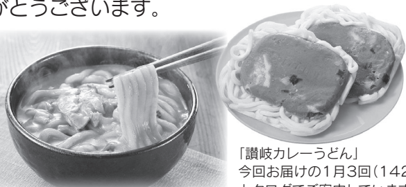
「讃岐カレーうどん」 今回お届けの1月3回(142号)の カタログでご案内しています。