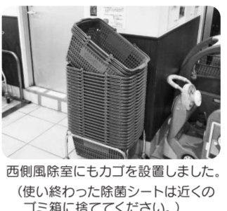
西側風除室にもカゴを設置しました。(使い終わった除菌シートは近くのゴミ箱に捨ててください。)

早速、写真のように、買い物カートと除菌シートをそばに買い物カゴを設置するようにいたしました。同じように思われていた組合員さんにもいらつたと思います。この度は、職員が気づかないことを教えていただき、ありがとうございました。