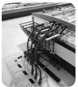
アイスクリームコーナー横のカート置き場

組合員さんより、「カゴを手にとって買い物をしてると、途中で思っていたより商品の量が増え、カートが必要になることがあります。お店の一番奥に来ている時には、わざわざ入り口に戻らなくてはなりません」という声をいただき、アイスクリームコーナーの横にもカートを用意しました。どうぞお気軽にご利用ください。反対にカートが必要でなくなった時には、ここに置いてください。常に3台くらい準備しますので、少なかつたり多かつたりの時には教えてください。