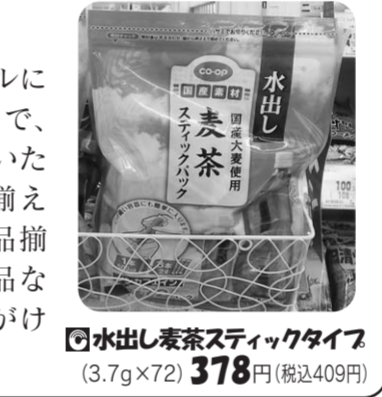
水出し 麦茶スティックタイプ (3.7g×72) 378円(税込409円)

組合員さんより、「ペットボトルに入れて作れる麦茶の素があるので、品揃えできませんか?」とご要望をいただきました。調べたところ、品揃えできる商品でしたので、すぐに品揃えしました。皆様もご要望の商品などありましたら、お気軽にお声がけください。