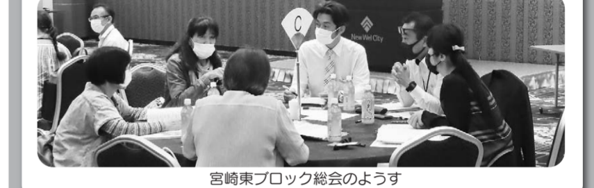
宮崎東ブロック総会の様子

6月21日(火)に開催されます第51回通常総代会(コープみやざきの「今年のすすめ方」や、昨年の「決算報告」など、組合員さん代表の「総代」さんが集まり議決される大切な会議)に先駆けて、5月17日(火)に宮崎東地区のブロック総会が開催されました。お店のことや共同購入に対することなど、たくさんのご意見をいただきました。宮脇店に対し「自転車置き場にカッパをかけるハンガーを準備して欲しい」とご要望をいただきましたので、柳丸店でも確認したところ、きちんと備えてありました。今後も皆様のご期待に沿えるよう、努力していきます。これからも柳丸店に対してお気づきのことがございましたら、お気軽にお近くの職員にお声がけください。