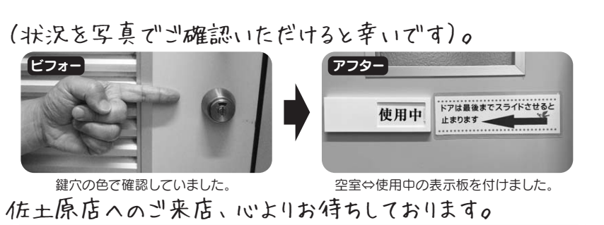
鍵穴の色を確認してました。 空室⇒使用中の表示板を付けました。

赤ちゃん石けんプレゼント ～出産された組合員さんご本人に、赤ちゃん石けんをさしあげます。お申し込みは、サービスカウンターまで!