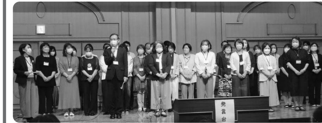
総代会で確認された役員について、その後開かれた第1回理事会・第1回監事会で、右のような役員体制が決まりました。