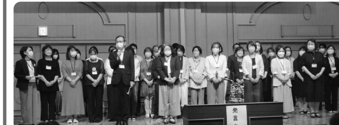
総代会で確認された役員について、その後開かれた第1回理事会・第1回監事会で、右のような役員体制が決まりました。