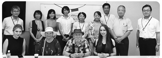
参加されたみなさん

お話を聴く中で、「戦争が始まって最初の1カ月はみんな、涙がでなくなるくらい泣いていたけど、今は『今日何人死んだ』という報道が、当たり前になってきている。関心が薄れていくのが怖い。宮崎の皆さんにも今のウクライナのことを知ってもらいたい」と話されていました。