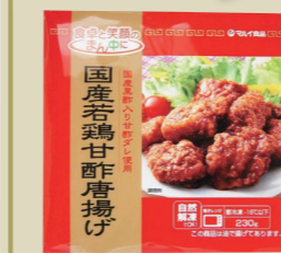
今週お届けの1月4回(143号)のカタログでご案内しています。