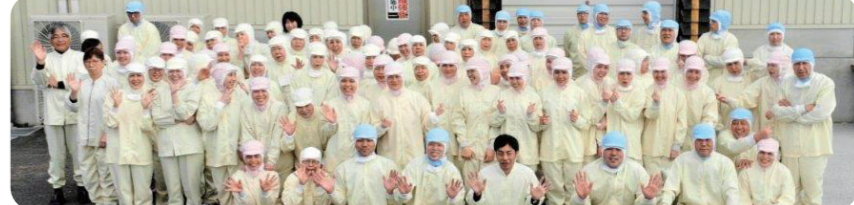
松尾工場のみなさん

今後も皆様に御愛顧いただけるように、引き続き「安心・安全」でおいしい食品づくりに尽力してまいりますので、今後とも弊社商品をご利用のほど、よろしくお願いたします。