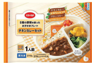
お子さまプレート チキンカレーセット

◆「柚子大根」 品揃え要望の声をを受けて、袋入りで商品化し、共同購入でも品揃えしました！