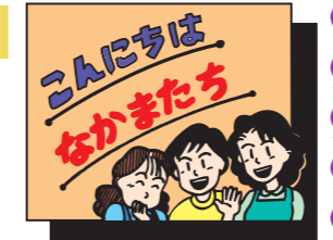
こんにちはなかまたち

お誘いしたい方に「お試し商品」を渡すことができます。ご希望の方は地域責任者まで声をおかけください。