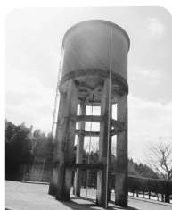
旧知覧飛行場給水塔 ポンプ式の給水塔が当時のままだと残されています。