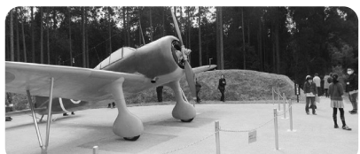
えんたいごう 掩体壕跡地 掩体壕とは、戦闘機を土壁で囲み、爆風や破片を防ぐためのシェルターです。