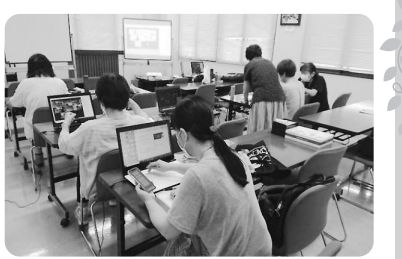
パソコン操作に四苦八苦!