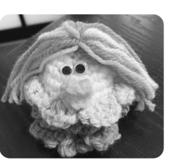
文字起こした資料と動画でかわいい「アマビエ」ができました。