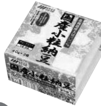
「国産小粒納豆」 今回お届けの3月2回(149号)の カタログでご案内しています。

地域責任者：うすあげが届いてますね。 組合員さん：このうすあげの中に、小粒納豆を入れてオーブンで焼くとおいしいよ！ごま油を少し垂らして焼いても香りが良くて、最高よ！ 地域責任者：手軽でいいアレンジですね。教えていただき、ありがとうございます。