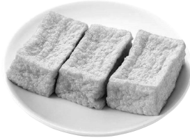
「九州産大豆きぬ揚げ」 今回お届けの3月2回(149号)の カタログでご案内しています。

組合員さん：きぬ揚げ、おいしいよね。 地域責任者：どうやって食べているんですか？ 組合員さん：生姜をすって、かつお節をかけて、しょう油をかけて、食べるだけ。本当においしいのよ。 地域責任者：シンプルなのがいんですね。 組合員さん：煮たりしてもおいしいけど、そのまま食べるのが私は好きなのよ。