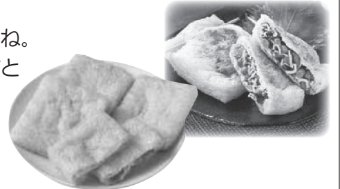
「国産うすあげ」 今回お届けの3月2回(149号)の カタログでご案内しています。