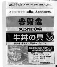
「吉野家の牛丼の具」 今回お届けの3月2回(149号)の カタログでご案内しています。