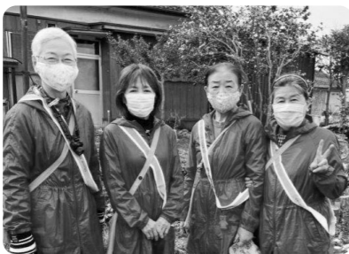
組合員さんとご友人

ウォーカーズ 都城市の組合員さん ウォーカーズの4人乙女 平均70歳。朝4時50分集合し、スタート。流星群とともに、「ああっ」とか「見えた」などと幼児にかえって、はしゃぐひととき。楽しい若返りの朝です。