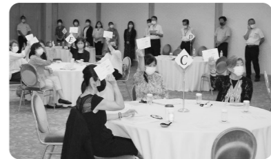
昨年の議案採決のようす

日時：6月21日(火) 午前10時～午後1時 会場：シーガイアコンベンションセンター