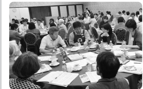
2019年の宮崎西ブロック総会のようす

5月17日(火)、18日(水)、19日(木)に分けて、県下11会場で開催されます。ブロック総会では、左記の総代会議案について、理事から説明・提案があります。その後、グループ討議を通して、自由に意見が出し合えるようになっています。グループ討議には、職員も参加しますので、日ごろ聴けない生協のことなど、その場で直接回答を聞くことができます。気軽に参加してください。 ※出されたすべての意見に対してブロック総会当日・または後日、個別に回答をお返しします。