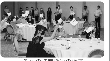
昨年の議案採決の様子

第51回通常総代会に、ブロック総会の声を持ち寄られます。 ○第51回通常総代会 6月21日(火曜) シーガイアコンベンションセンター 前年度の取り組みを振り返り、今年度取り組むことを決める、生協の最高議決機関です。 2022年度は337人の総代さん(組合員の代表で生協における国会議員のようなもの)の採択によって、提案した6つの議案について、議決が行われます。