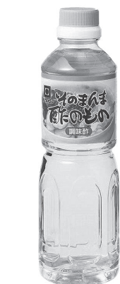
「そのまんま酢のもの」 次回、7月1回(214号)の カタログでご案内します。