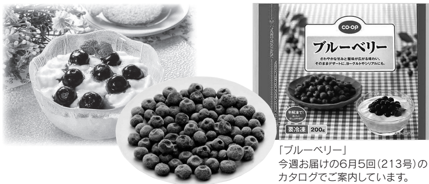
「ブルーベリー」 今週お届けの6月5回(213号)の カタログでご案内しています。