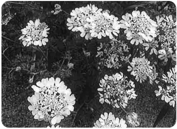
昨年の春に咲いたオルレアです。 種を取り、昨年10月に植えました。

発行 生活協同組合コープみやざき 理事会 所在地 〒880-8530 宮崎市瀬頭2丁目10番26号 電話 (0985)32-1234 FAX(0985)32-3355 ホームページアドレス https://www.miyazaki.coop