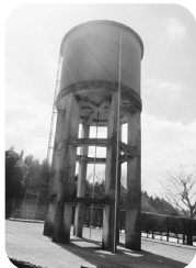
旧知覧飛行場給水塔 ポンプ式の給水塔が当時のまま残されています。