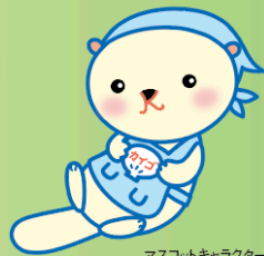
マスコットキャラクター「かいこん」