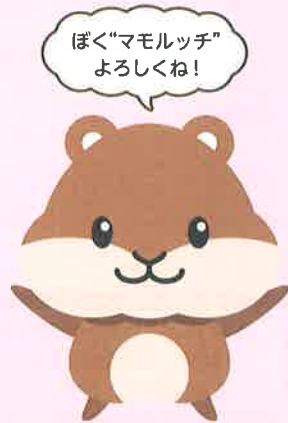
「新コープのケガ保険」 マスコットキャラクター マモルッチ