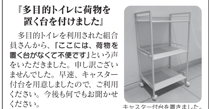
キャスター付台を置きました。

『多目的トイレに荷物を置く台を付けました』 多目的トイレを利用された組合員さんから、『ここには、荷物を置く台がなくて不便です』という声をいただきました。申し訳ございませんでした。早速、キャスター付台を用意しましたので、ご利用ください。今後も何でもお聞かせください。