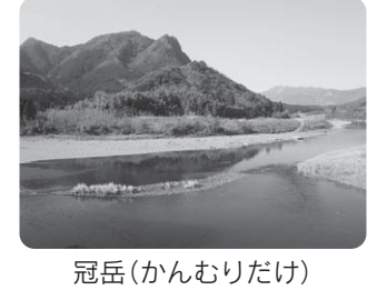
冠岳(かんむりだけ)

『すぐに標識が見えるようにしました』 『お店前にある道路ですが、「歩行者に注意!!」という看板が、木の枝に隠れてしまい見えにくくなってます』という声をいただきました。すぐに確認してみると、標識の横にある木の枝が覆いかぶさり、文字が見えなくなっていました。この後この枝を切って見えるようにしました。教えていただき、ありがとうございました。今後もすぐに改善を進めていきます。