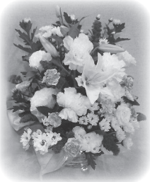
(お花を受け取られた 愛知県の方)

何度もお花を送っていただいています。お水もいつもたっぷりです。知人に届いた花は前面にしか花がなかったそうで(後ろは絶壁)、コープのお花はいつも良心的でステキです。