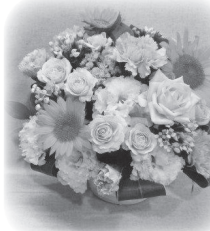
(宮崎市の 組合員さん)

相手の方が高齢でしたので、華やかさの中にも優しく元気をいただくお花をアレンジしていただき、満足しております。本当にありがとうございました。