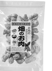
「大豆で作りました畑のお肉ブロック」

ご要望いただきました、信州物産『大豆で作りました 畑のお肉ブロック』について、取引先に確認しましたところ、カタログでの取り扱いが可能でした。また、現品を取り寄せて確認した後、唐揚げにして食べてみましたところ、確かに食感も唐揚げに近いと思ひました。使いたい分だけ水で戻して使え便利であること、カタログでは大豆ミートを使用した加工品がよく利用されている状況などを踏まえ、新たに品揃えを進めてまいりたいと思ひます。