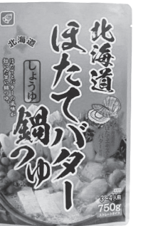
「北海道ほたてバターしょうゆ鍋つゆ」

ご要望の商品は、ベル食品さんの『北海道ほたてバターしょうゆ鍋つゆ』ではないかと思ひます。調査をおこない、ご利用いただいている大塚店で品揃えが可能となりました。鍋つゆコーナーでご案内します。陳列場所など分からない場合は職員へお尋ねください。共同購入カタログでは、今回の店舗での状況などを考慮し、次期品揃え検討の際にあらためて品揃えの検討をいたします。