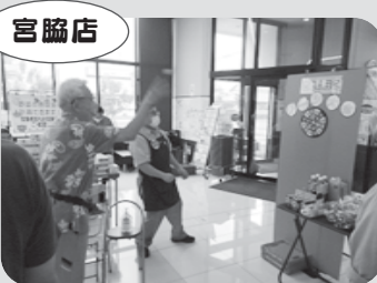
9月「敬老の日」ダーツゲーム