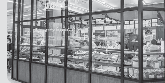
ベーカリーコーナーに仕切りをつけました。

コロナ禍で中止していたイベントも、3年振りに再開しました!ご来店いただいた組合員さんや、ご家族の方たちにも喜んでいただきました。