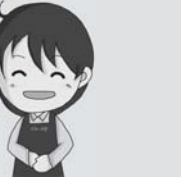
今後も、ご来店いただいた皆様に楽しんでいただけるよう、イベント等を行っていきます。