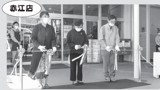
テープカットのようす

10月29日(土)に赤江店(宮崎市)がリニューアルオープンしました。一部陳列棚を新しい物に変更。ベーカリーコーナーも広がり、商品が選びやすくなりました。