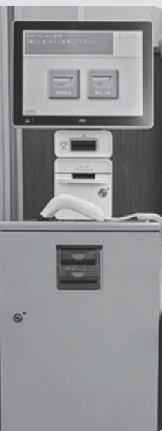
オレンジ色のボックスが目印です