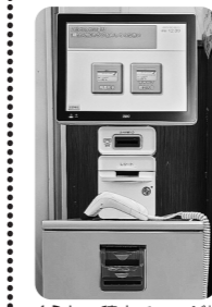
くらしの積立チャージ機 オレンジ色のボックスです!

コープみやざき独自のキャッシュレス決済として「くらしの積立」の仕組みがあります。くらしの積立はコープカードでチャージができ、お支払いもくらしの積立からキャッシュレスでできます。各店舗に設置してある「くらしの積立チャージ機」でチャージするか、レジ職員にチャージする旨を伝えていただければチャージできます。お買い物の際は、コープカードを出して「くらしの積立で支払いを」と伝えていただければ、くらしの積立の残高から支払いができます。