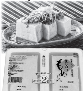
今回お届けの5月3回カタログ(307号)でご案内します。

少し柔らかくて食感が良く、また国産大豆使用で美味しく安心して食べられます。お味噌汁やマーボー豆腐、鍋料理などいろいろな料理にかかせません。3人家族なので2分割が重宝します。