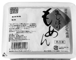
今回お届けの5月3回カタログ(307号)でご案内します。

国産大豆・にがりで作って生しほり製造だからしょう油!しっかり大豆の風味が口に広がり、とても美味しいと思います。夏は冷やっこ、冬は湯豆腐など、マーボー豆腐にも使い、ほど良く角がくずれ味がしみて大好きです。