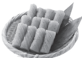
次は5月4回カタログ(308号)でご案内します。

嫁いで40年、母の手作り地こんにゃくをずっと食べてきましたが、2年前から母も作れなくなり、さみしい思いをしていました。煮しめを作るのにこんにゃくがないと様にならず、たまたまカタログの「ねじり糸こんにゃく」を注文して作ったところ、主人の口にぴったり合い大絶賛です。それから出る度に買って、ヘルシー食材でいろいろアレンジして使っています。