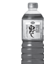
今回お届けの5月3回カタログ(307号)でご案内します。

これだけで味がばっちり決まるのでずっと使っています。茶わん蒸しなどは、前は「あ〜めんどくさ〜」と思っていたのが、今は秒で決まるので冬はたびたび食卓に上がります。