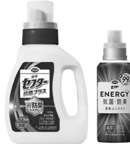
今回お届けの5月3回カタログ(307号)でご案内します。

わが家には野球部の息子がおります。夏場は家族全員汗かきです。市販の高値の洗剤でもなかなかおいが残って困っていたところ、息子に勧められて「液体セフター抗菌プラス」と「ENERGY抗菌・防臭」を使いだして気にならなくなりました。値段も安いし、大変助かっています。安い時に箱買いしています。配達の方には申し訳ないです。