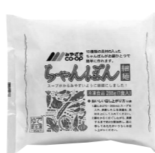
今回お届けの5月3回カタログ(307号)でご案内します。

麺類が好きではない私は麺類の料理が少なく、お昼に冷凍ちゃんぽん麺を作ると、主人いわく「今日はごちそうじゃ!」とニンマリしています。「これが一番おいしい!」(他のものは作ったことがない!) 「ああ、美味しかった!」と言い、満面の笑顔で午後からの山仕事に出かけ、頑張っていますよ!