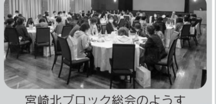
宮崎北ブロック総会の様子

5月25日(木)に51名の組合員さんのご参加で、北ブロック総会が開催され、たくさんの声をいただきました。ご意見をいくつか紹介します。 「母の日のバラエティ弁当が美味しかった」「組合員なら7円引きになるガソリンスタンドがあり、お得です」「必要な量目にも小分けしてくれるのが良い」など、嬉しい声をたくさんいただく一方で、「制服のズボンの裾が地面についている職員がいて、衛生面で不安がある」「ドレッシングのいろいろな味を楽しみたいので、小サイズの物を品揃えて欲しい」等のご意見やご要望もいただきました。制服に関しては改めて、職員が互いに確認し合うようにしました。ドレッシングについては、商品部で調査してもらっています。 ご意見やご要望はしっかりと受けとめ、改善につなげていきます。今後もお気軽ににお近くの職員にお声がけください。