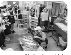
昨年のこども店長の様子

『こども店長』を今年も夏休みに開催します。夏の思い出はもちろん、夏休みの自由研究にもなります。ご参加をお待ちしています。 ●8月6日(日) 午前11時～ 午後3時～ (時間は30～40分程度の予定です) ●午前・午後の部とも6名程度 ●対象は小学生程度 ●仕事内容は加工場の見学、店内放送など ●応募締切 7月31日(月)