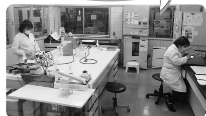
商品検査をしている様子

食品腐敗と食中毒の原因となる微生物が基準内におさまっているかどうかの検査を行っています。