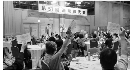
昨年の議案採決の様子

前年度の取り組みを振り返り、今年度取り組むことを決める、生協の最高議決機関です。