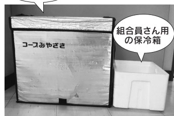
組合員さん用の保冷箱