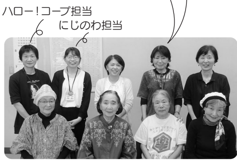
検討委員のみなさん

にじのわ・ハロー!コープ検討委員会では、『にじのわ』『ハロー!コープ』を読んでの感想やご意見、中身を通して知りたいこと、その他まわりで今話題になっていることなどをお聴かせいただいています。ここで聴いた声をもとに、組合員さん同士や生協との情報交換がより広がるようにしたいと思います。和気あいあいとした楽しい場です!参加してみませんか。