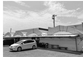
百姓新鮮市場さん(宮崎市)

県内約200カ所のお店(酒屋・クリーニング店など) お店とコープみやざきが契約をしています。受取曜日・時間などのくわしいことは、最寄りの支所・地域責任者へお問い合わせください。