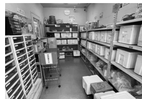
花ヶ島店受取場所の様子

県内11の支所や16の店舗でも、共同購入(カタログ)の商品を受け取れます。最寄りの支所・店舗職員へお気軽に声をおかけください。