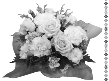
▲アレンジ3,300円の一例です (写真のアレンジは約25cmです)

吊花でしたので菊が中心と思っておりましたが、希望があればと言ってくれたのがとてもうれしかったです。母が喜んでくれたのがうれしかったし、日時も決められたのでスムーズに受け取れたのもほっとしました。(ご利用された西都市の組合員さんより)