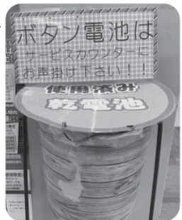
この回収箱は8/28までです。

8月29日以降、「使用済乾電池」の処分につきましては、お住まいの自治体の回収方法に従ってご対応ください。今までご利用されていた皆様には大変ご不便おかけしますが、何卒ご理解くださいますようお願いいたします。