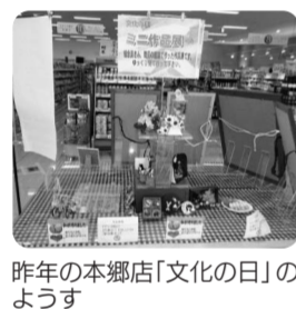
昨年の本郷店「文化の日」のようす

コープみやざきは今年設立50周年を迎えました。組合員さんとともに楽しみ喜び合える企画「文化祭」を、11月「文化の日」に合わせて開催します。 「文化祭」として各店舗(屋内)で展示する作品を組合員さんから募集します。来店される組合員さんに楽しんでいただくと嬉しいです。