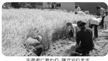
生産者に教わり、鎌で刈ります。