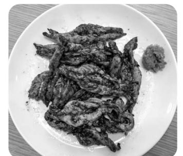
柚子胡椒も合います

(鶏の首にあたる部位)」です。コリコリと弾力を併せもつ食感に、ほど良く脂ものっているのので、ご飯のおかずにも!酒の肴にも!よく合います。仕事後の入浴前に、ポウルに肉とたれを入れて漬け込むと、入浴後にちよよいい感じになります。