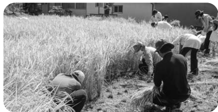
生産者に教わり、鎌で刈ります。