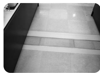
レジの床を補修しました。

他にも私たち職員が気づかないことがあるかもしれません。困ったことがありましたら、ぜひ教えてください。