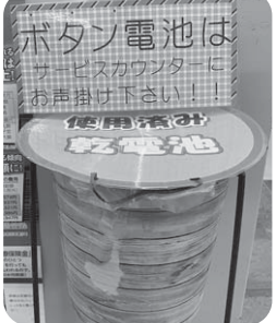
この回収箱は8/28までです。

8月29日以降、『使用済乾電池』の処分につきましては、お住まいの自治体の回収方法に従ってご対応ください。今までご利用されていた皆様には大変ご不便おかけしますが、何卒ご理解くださいますようお願いいたします。