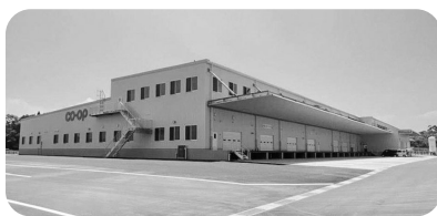
新しい商品センター(清武町)

今年10月には新しい商品センターが稼働します。共同購入がますます組合員のみなさまのお役に立てるよう取り組んでまいります。