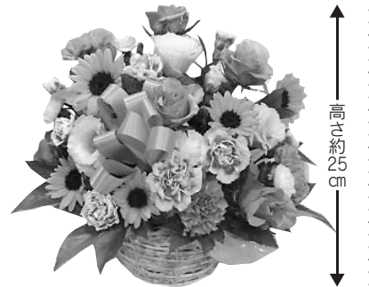
3,300円(税込み)のお花の一例です。

お申し込み・お問い合わせは 生活サービスセンター (電話) 0985-29-5800 (FAX) 0985-28-0033 営業: 月曜～土曜 (9:00～17:50)