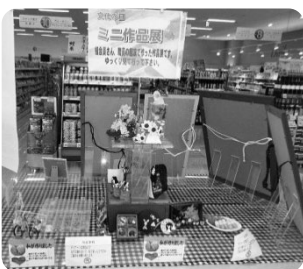
昨年の「文化の日」のようす

コープみやざきは今年設立50周年を迎えました。組合員さんとともに楽しみ喜び合える企画『私たちの文化祭』を、11月3日「文化の日」にあわせて開催します。