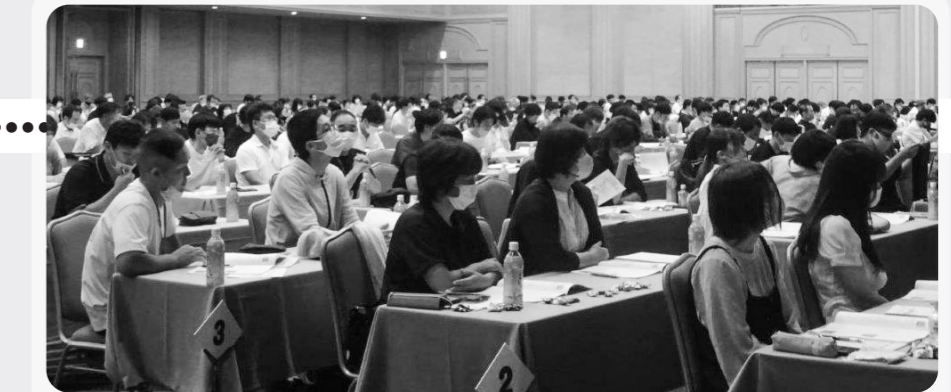
7月22日 シーガイアコンベンションセンターで開催された発表会

※お約束便・・・組合員さんが欲しい商品を。あらかじめ登録しておく仕組みです。商品を登録するとその商品がカタログで品揃えされた時に、指定された個数届きます。