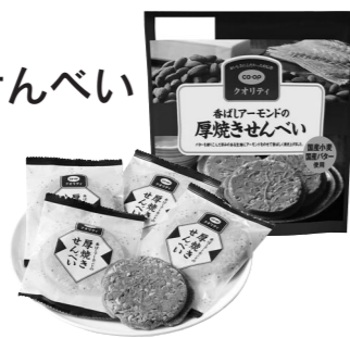
香ばしアーモンドの厚焼きせんべい 11月4回カタログ (334号)でご案内します。

常に家に置いてあります。夫も、毎日食後のちょっとしたデザート風に1枚食べています。サクサクした食感、アーモンドの香ばしい歯ごたえが大好きです。足りない時はコープのお店まで買いに行きます。