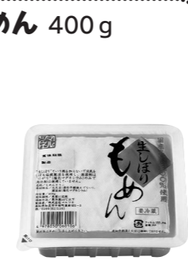
今週お届けのカタログ 11月1回(331号)で ご案内しています。

いろいろな豆腐を食べましたが、生協の生しほりもめんが一番おいしいです。毎週2個は頼みます。