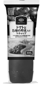
トマトと5種の野菜入り ケチャップ 11月4回カタログ (334号)でご案内します。

わが家はトマト料理が好きでよく作ります。これをそのままオムレツや目玉焼きなどにかけて食べたり、トマト煮込み料理の際は必ず使います。濃厚で野菜の味がブレンドされていて、深い味わいがありとてもおいしいです。