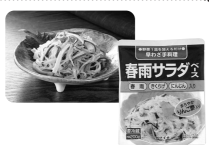
今週お届けのカタログ 11月1回(331号)でご案内しています。

あと1品欲しい時、時間がない時にすぐ便利です。職場の人にプレゼントしたらすごく気に入ってくれて、「特価の時に注文して」と言われて注文しています。ちょっとお礼にと思う時に便利で、いつも常備しています。