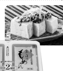
今週お届けのカタログ 11月1回(331号)でご案内しています。