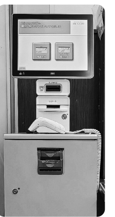
くらしの積立チャージ機 オレンジ色のボックスです!

※レシートにくらしの積立残高表示を希望される場合は、サービスカウンターへお申し出ください。