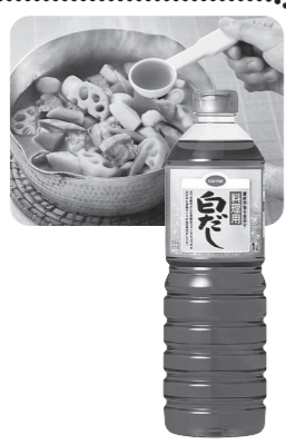
今週お届けのカタログ 11月1回(331号)で ご案内しています。

他県から引越してきて、たどり着いた味が「白だし」でした。わが家の子もたち3人は宮崎から離れた折には、「白だし送って~」と催促がきます。どんな料理にも、隠し味にも1滴。有名どころのうどん・蕎麦屋さんのつゆより、白だしを使ったつゆが1番です。