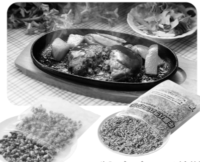
牛豚バラミンチ(合挽) 300g 今週お届けのカタログ 11月1回(331号)で ご案内しています。

30年程前に、生協のひき肉でハンバーグを作った時のファンです。丸く形を作る時、手に油がつかなくなったこと、娘たちが「おいしい!おいしい!」と言いながら食べていたこと、今でも忘れません。この時に生協の食品の品質の良さ、安全を実感し、生協との付き合いが始まったと言っても過言ではありません。今は孫のために生協のひき肉でハンバーグを作ります。