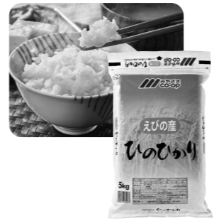
えびの産 ひのひかり 今週お届けのカタログ 11月1回(331号)でご案内しています。

県外に住む次々が帰省すると、必ずこのお米の炊きたてごはんを「卵かけごはん」にして、「これよ!これ~!」「おいしい!」って。おかずはいらないそうです(笑)。宮崎のお米が一番おいしいそうですよ~。たまに2キロ入りのお米を送ると、ものすごく喜びます。