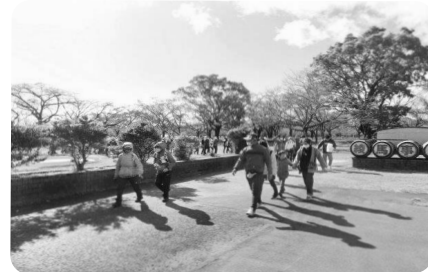
各コースに分かれてスタート。