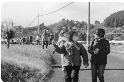
綾の風景をながめながら歩きました。