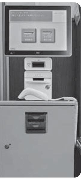
オレンジ色のボックス

レジでの支払いには、現金以外に「くらしの積立」の支払いもあります。ご本人のコープカードを使って、前もって「くらしの積立」にチャージ(入金)しておく、レジで現金を用意することなく、くらしの積立からお支払いができます。「くらしの積立チャージ機」をぜひご利用ください。