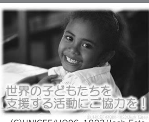
世界の子どもたちを支援する活動にご協力を!

「バケツ一杯の水」を贈る運動として、ユニセフ募金に取り組んだのが1979年でした。それから毎年、全国の生協がユニセフ「お年玉募金」に取り組み、多くの組合員さんからたくさん募金をいただいています。今年も世界の子どもたちのために、皆様のご協力をよろしくお願いいたします。