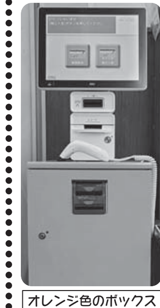
オレンジ色のボックス

レジでの支払いには、現金以外に「くらしの積立」の支払いもあります。ご本人のコープカードを使って、前もって「くらしの積立」にチャージ(入金)しておく、レジで現金を用意することなく、くらしの積立からお支払いができます。「くらしの積立チャージ機」をぜひご利用ください。