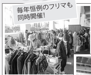
毎年恒例のフリマも同時開催!

11月25日(土曜)・26日(日曜)の2日間、シーガイア松泉宮グリーンガーデンにて、昔懐かしい『生協まつり』が復刻!ステージイベントやフリーマーケット、模擬店など楽しい催しで、大盛り上がりな2日間となりました。