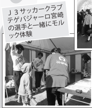
J3サッカークラブ テゲバジャーロ宮崎の選手と一緒にモルック体験