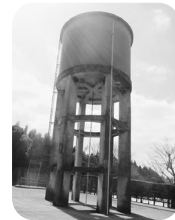
旧知覧飛行場給水塔 ポンプ式の給水塔が当時のまま残されています。