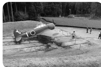
掩体壕跡地 掩体壕とは、戦闘機を土壁で囲み、爆風や破片を防ぐためのシェルターです。