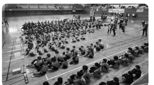
子どものドッチボール大会の様子(表彰式) 今年も県大会で3位入賞しました。

4月は新生活がスタートする時期ですね。進学、就職、転職などで、生活が大きく変化する方もいらっしゃると思います。新生活に慣れるまでに時間がかかると思いますが、焦らず楽しんでほしいですね。わが家の息子は、いよいよ小学6年生！ようやく生まれてきてくれた時のことや、不安や期待に胸を膨らませ、少し緊張した表情で迎えた小学校入学式などが、ついでにこのように感じます。体もだんだん大きくなり、先日は体育館シューズを買いに行ったところ、サイズが24cmになっていて、妻のサイズより大きくてビックリしました。ドッチボールのスポーツ少年団チームに入り仲間もたくさんできて、県大会3位に入賞するなど、充実した生活を送っています。小学生生活もあと一年！体だけでなく、心も大きく育ててほしいと願っています。