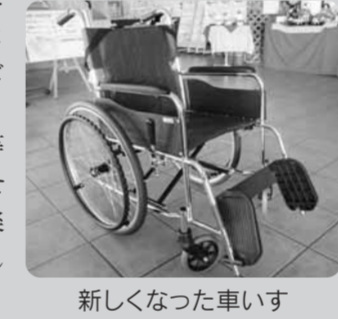
新しくなった車いす

<車いすを新しくしました> 組合員さんより、「母親を花ヶ島店に買い物に連れて行った時に車いすを利用していますが、古くて重いので使いにくいです」とのお話を伺いました。改めて確認すると、オープン時から18年ほど使っているもので、あちこちサビもあり押すのが重くなっていると感じました。私自身の確認ができておらず、ご不便をおかけし申し訳ないと思われました。早速、新しい物を2台手配し、入れ替えました。少しはスムーズにお買い物を楽しんでいただけるようになったのでは、と思います。お知らせいただきありがとうございます。今後お気づきのことやご要望等がございましたら、何でもお聞かせください。気持ち良くお買い物を楽しんでいただけるように、改善していきます。