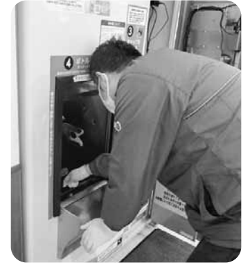
毎月、お取引先の方がみえて、メンテナンスをしていただきます。本当にありがとうございます。