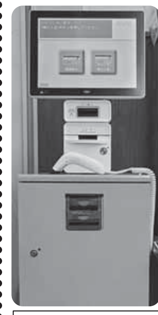
オレンジ色のボックス

レジでの支払いには、現金以外に「くらしの積立」の支払いもあります。ご本人のコープカードを使って、前もって「くらしの積立」にチャージ(入金)しておくと、レジで現金を用意することなく、くらしの積立からお支払いができます。「くらしの積立チャージ機」をぜひご利用ください。