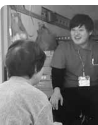
地域責任者と組合員の会話の様子

2025年度採用の総合職(正規)職員を募集するにあたり、説明会と一次試験を実施します。一次試験は5月4日、または6月8日のいずれかを受験してください。