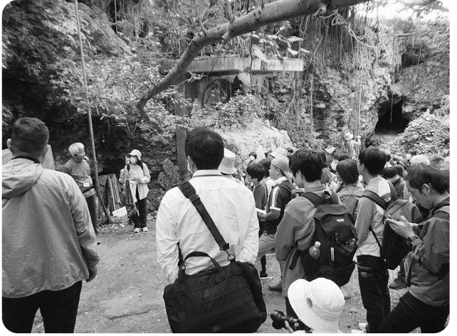
ピースアクションinオキナワ アブチラガマの見学