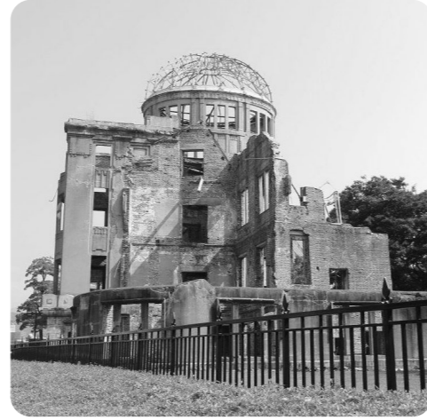
広島市 原爆ドーム

6月2回のにじのわで平和のメッセージを募ったところ、多くの組合員さんからお寄せいただきました。一部ご紹介します。ご自身のつらい体験や、ご家族から伝え聞いたお話など、平和への強い願いを届けてくださったみなさま、ありがとうございました。