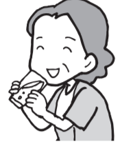
国富町の組合員さん(60代)

東京では街中に無料給水所がたくさんあるとニュースで聞いて、宮崎にはないよなあと思っていましたが、お陰様で生協の休憩所を利用させてもらっています。