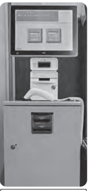
オレンジ色のボックス

レジでの支払いには、現金以外に『くらしの積立』の支払いもあります。ご本人のコープカードを使って、前もって『くらしの積立』にチャージ(入金)しておくと、レジで現金を用意することなく、くらしの積立からお支払いができます。「くらしの積立チャージ機」をぜひご利用ください。