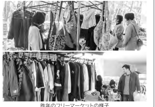
昨年のフリーマーケットの様子