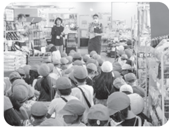
社会科学習に来られた 国富小3年生の皆さん

が動いていて、ラップをされた商品が出て来ると、「すごい!」の声。また、大きな冷凍庫に入っていました。寒い、寒い」と言いながら笑顔でした。質問コーナーもあり、「店長さんは、なぜ生協で働こうと思ったのですか?」「どうしてコープと言う名前なのですか?」「残った商品は、どうするのですか?」「値引きは何時頃からしているのですか?」など、たくさんの質問をいただき、こちらも笑顔で回答しました。8月に開催の『こども店長』に参加してくれた生徒さんもいて、嬉しく思いました。将来、本郷店で働いてくれる生徒さんがいて欲しいと思いました。楽しい時間をありがとうございました。