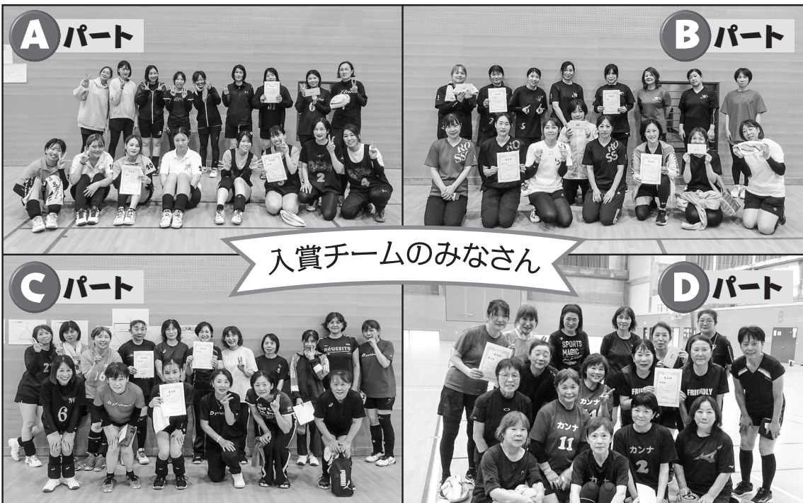
入賞チームのみなさん

参加いただいたみなさまには、コート設営・片付けなどの運営をお手伝いいただきました。ご協力ありがとうございました。