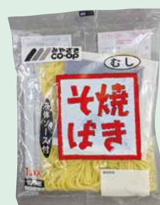
「焼きそば(液体ソース付)」 今回(542号)のカatalogでご案内しています。